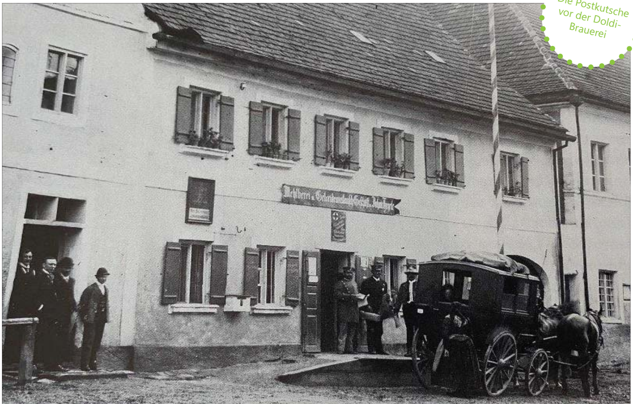
Die Postkutsche vor der Doldi-Brauerei