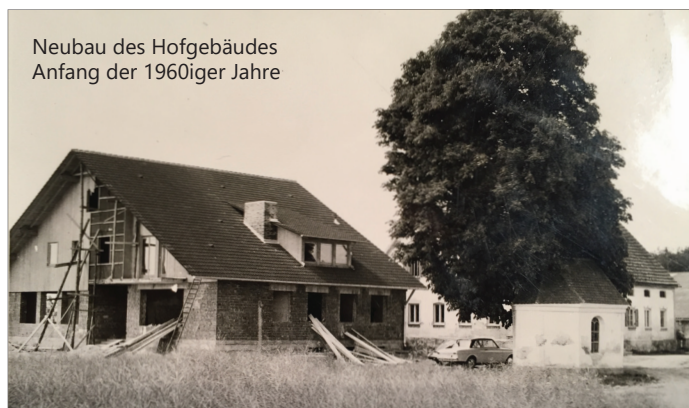
Neubau des Hofgebäudes Anfang der 1960iger Jahre